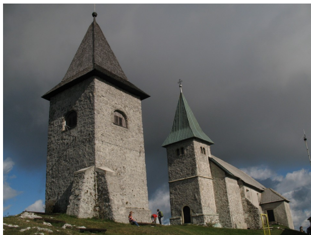
avtor: Boštjan Borštnar

Planinski čevlji ali čevlji s trdim podplatom, oblačila primerna trenutnim razmeram (kapa, rokavice, vetrovka, gamaše,...)